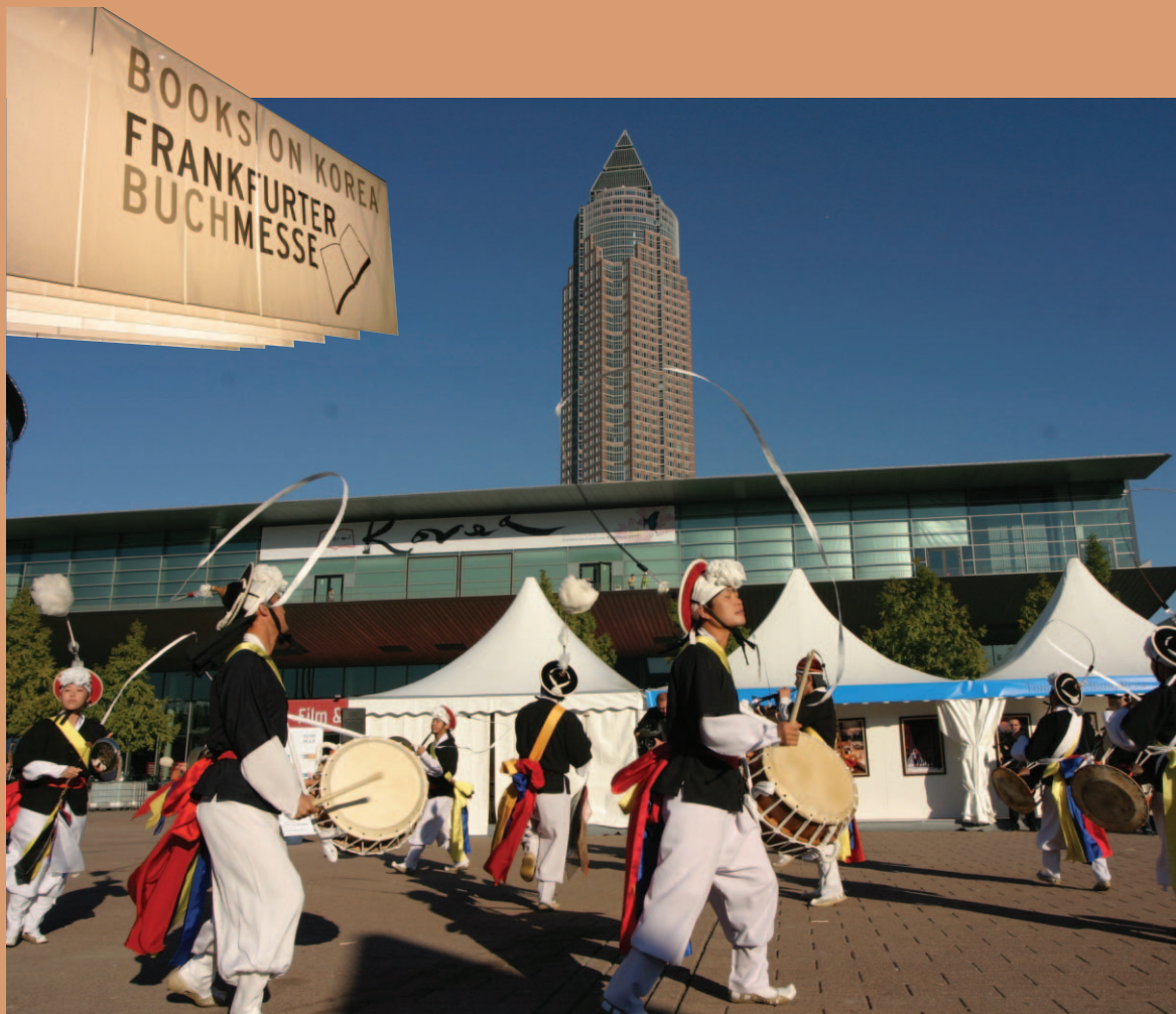
아래 · 도서전의 취지에 맞게 재구성한 한국의 전통사물놀이 공연을 한자리에 펼쳐보여 관람객으로 하여금 탄성을 자아냈다.

들이 배워야 할 점도 많은 근대국가로 인식하게 된 것은 큰 성과라고 인정할 수 있다.