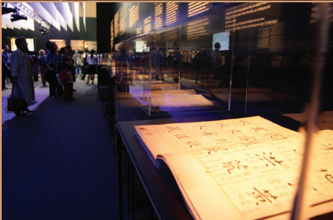
위 · 프랑크푸르트 도서전이 열린 전시장 내부전경 아래 · 현존 세계 최고(最古)의 금속활자 인쇄물인 「직지심체요절(直指心體要節· 직지)」(1377)을 도입부로 한국 출판의 역사를 선보인 코너