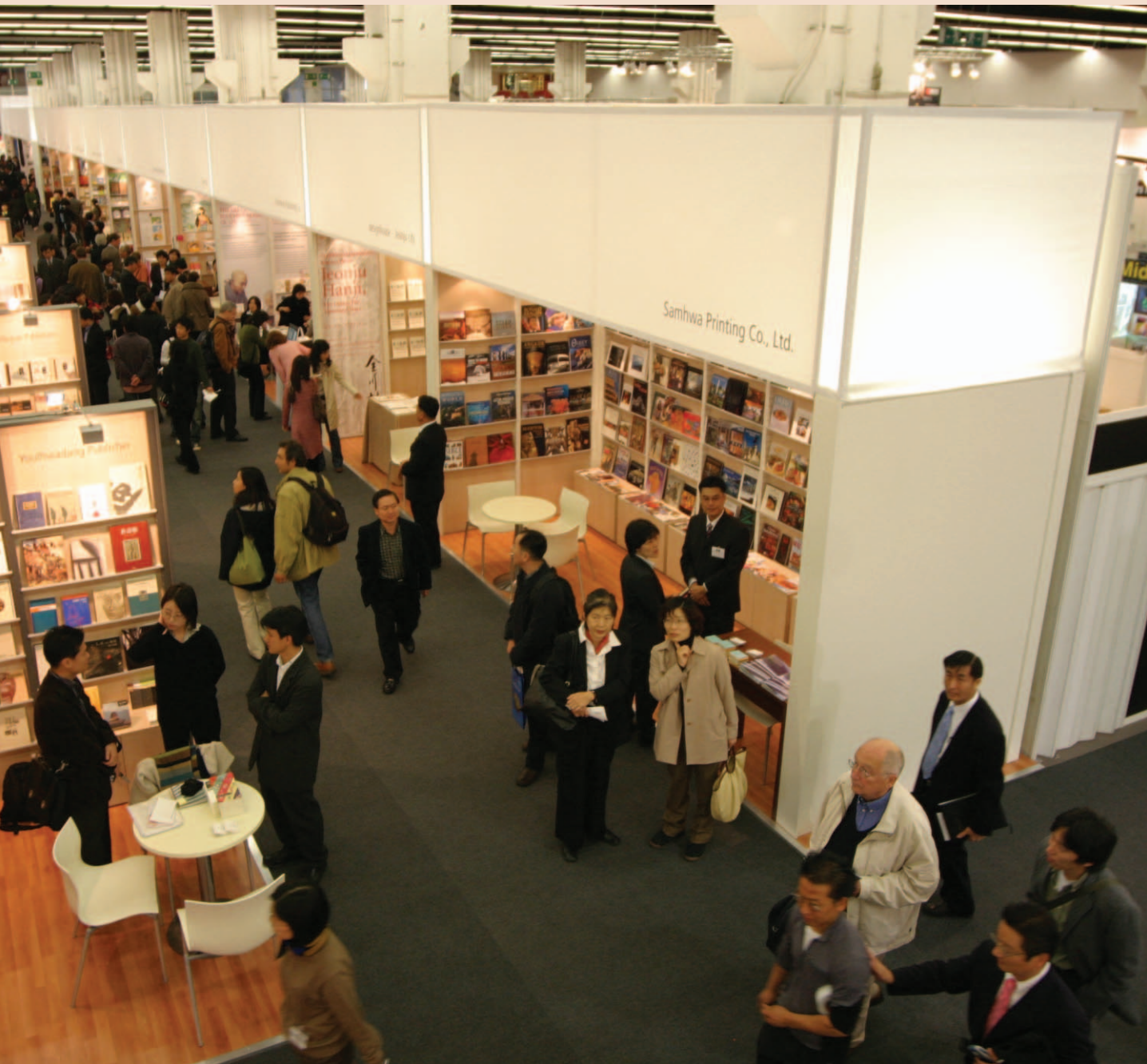
프랑크푸르트 도서전의 한국관 전경

2005년 10월 18일 개막식을 시작으로 23일까지 한국이 주빈국으로 참여한 프랑크푸르트 도서전이 열렸다. 이 기간을 전후해 국내 신문과 방송이 독일 현지에서 쏟아낸 보도와 독일 관객들이 나타낸 한국 문화에 대한 관심은 거꾸로 우리에게 이번 도서전과 독일인들, 그리고 우리 문화에 대해 다시 돌아볼 기회를 제공하고 있다.