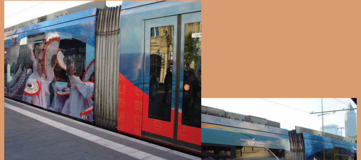
위 · 프랑크푸르트 도서전이 열린 전시장 내부전경 가운데 · 한국의 전통 놀이문화, 독일인 관객들이 나타난 한국 문화에 대한 관심은 거꾸로 우리에게 이번 도서전과 독일인들, 그리고 우리 문화에 대해 다시 돌아볼 기회를 제공하고 있다. 아래 · 한국을 홍보하는 내용으로 장식된 전철. 도서전 개막 이전부터 도심을 지나다니며 주빈국 한국에 대한 호기심을 불러일으켰다.