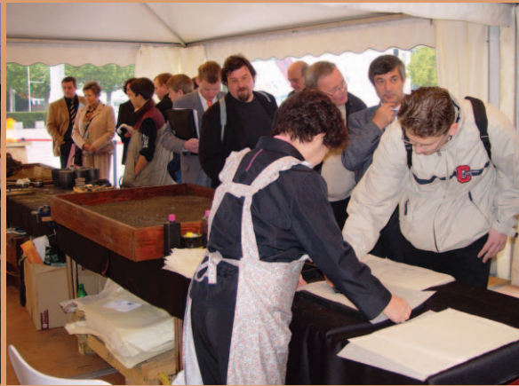
오른쪽 · 도서전 기간 중 매일 목판인쇄와 한지 제조 및 금속활자 주조 과정이 시연돼 문객들의 발길을 잡았다.