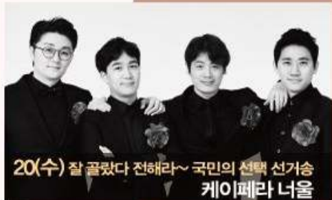
20(수) 잘 골랐다 전해라~ 국민의 선택 선거송 케이페라 너울