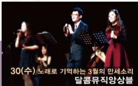
30(수) 노래로 기억하는 3월의 만세소리 달콤뮤직앙상블