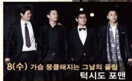
8(수) 가슴 뭉클해지는 그날의 울림 턱시도 포맨