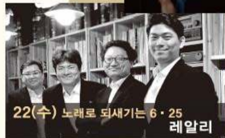
22(수) 노래로 되새기는 6·25 레알리