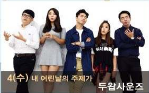
4(수) 내 어린날의 주제가 두왁사운즈