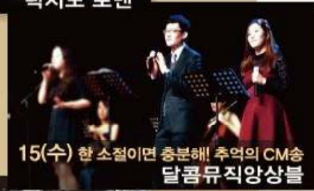
15(수) 한 소절이면 충분해! 추억의 CM송 달콤뮤직앙상블