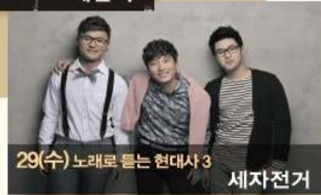
29(수) 노래로 듣는 현대사 3 세자전거