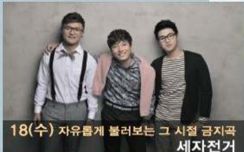
18(수) 자유롭게 불러보는 그 시절 금지곡 세자전거