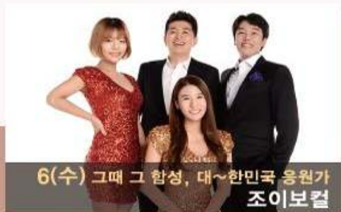
6(수) 그때 그 합성, 대~한민국 응원가 조이보컬