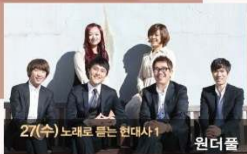
27(수) 노래로 듣는 현대사 1 원더풀