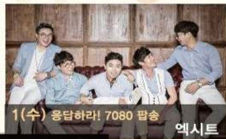
1(수) 응답하라! 7080 팝송 엑시트