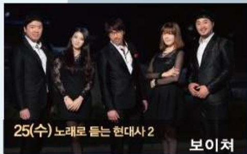
25(수) 노래로 듣는 현대사 2 보이쳐