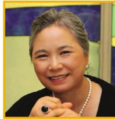
이연한 OKF 회장