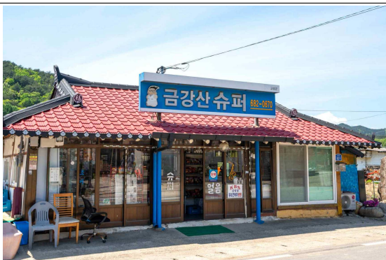
대한민국 최북단 마을 명파마을(明波) 밝을 명, 파도 파

민통선 마을로 동해의 맑은 물과 백사장을 낀 아름다운 경관을 가졌지만, 휴전 이후 주민이 살지 않았던 침묵의 땅이자 57년도 출입 영농으로 개방되어 영농인이 이주한 마을, 금강산 관광으로 특수를 누릴 때도 있었지만, 그마저도 10년 만에 중단되면서 다시 역사의 뒤편길로 사라질 위기에 놓여 있는 소멸위기 마을