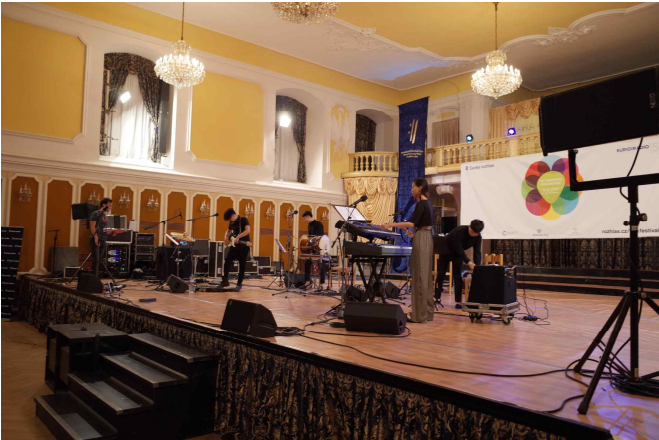
공연 당일 사운드체크(7.22)