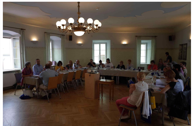
Euro radio Folk Producers 총회 참석(7.22)