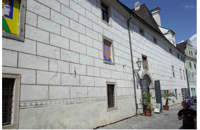
에곤 실레 미술관 전경(7.21 참관)