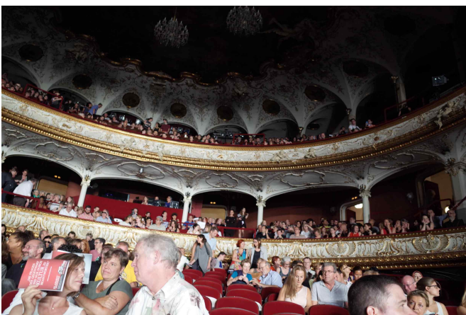
임펠스탄츠 페스티벌 <WAR> 공연 현장 - Volkstheater