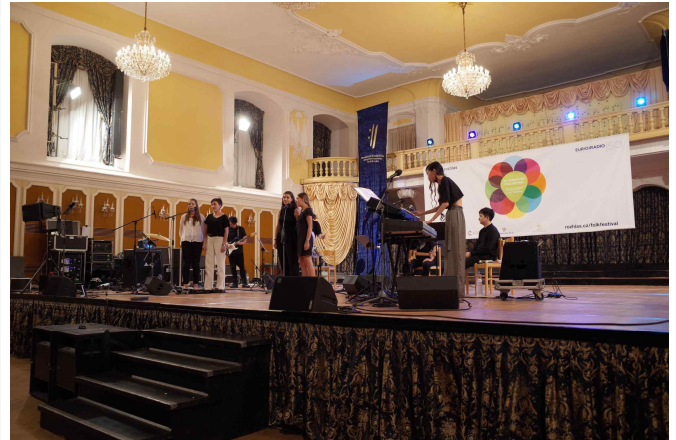
누모리(nuMori)와 현지공연단의 '아리랑' 공연(7.22)