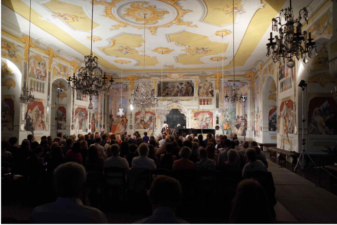
미샤 마이스키 공연 관람(7.20)