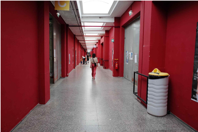
댄스웍 스칼라십 현장(아르세날레)