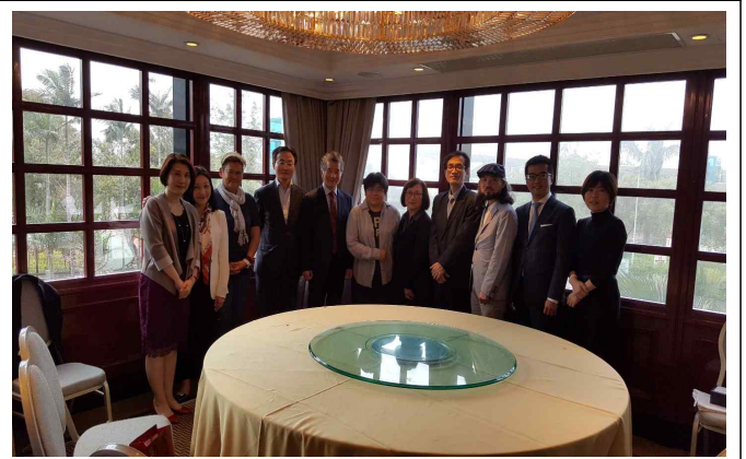
△ 홍콩예술발국 간담회 단체 사진