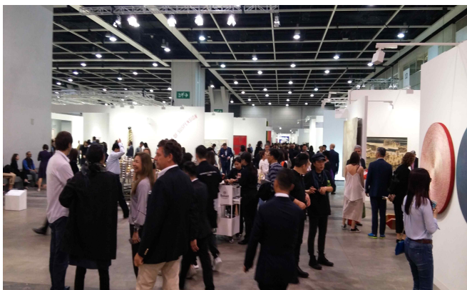
△ 홍콩아트바젤 참관