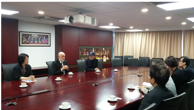
△ 공연예술 홍콩아카데미 방문 및 면담