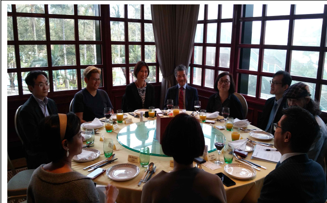
△ 홍콩예술발국 행정총재 및 위원 간담회