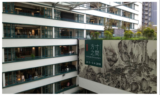
△ 복합문화공간 PMQ 방문