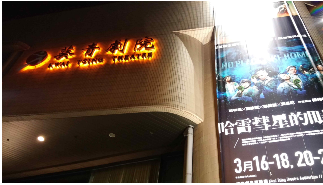
△ 홍콩아트페스티벌 무용공연 관람