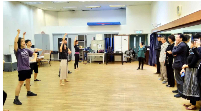
△ 공연예술 홍콩아카데미 수업 참관