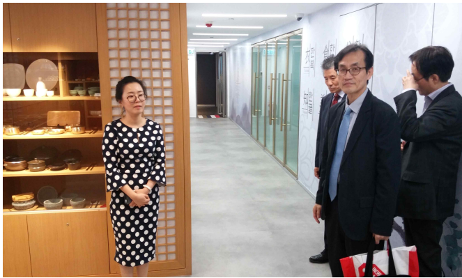
△ 주홍콩 한국문화원 방문