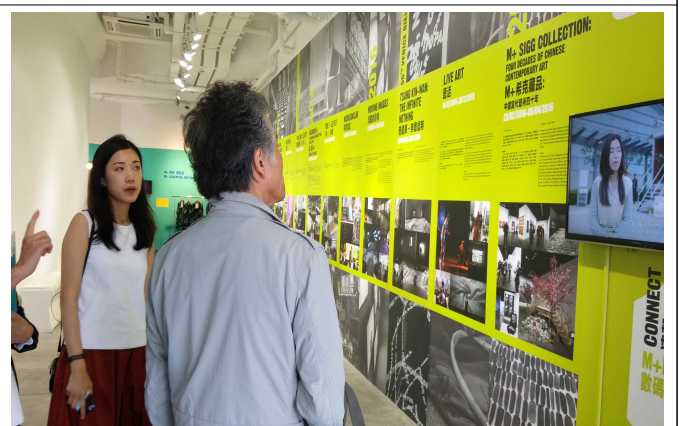
△ 홍콩 서구룡예술지구 M+특별관 전시 관람