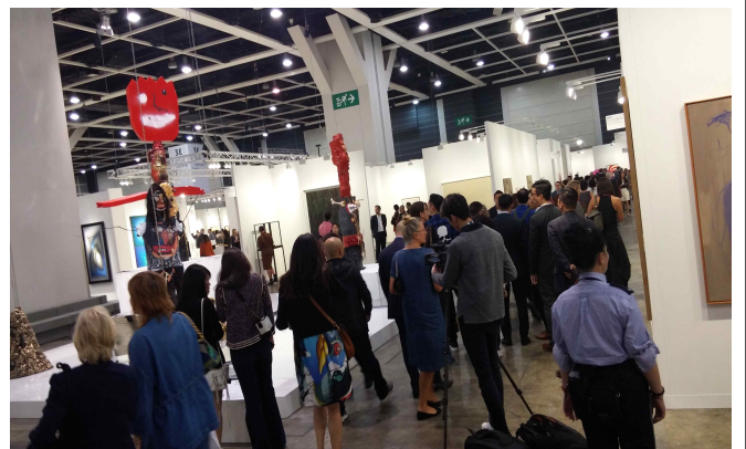
△ 홍콩아트바젤 참관