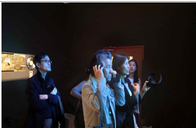
△ 홍콩 서구룡예술지구 M+특별관 전시 관람