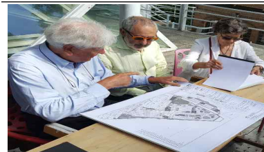
[한국관 증축 초기계획안 설명]