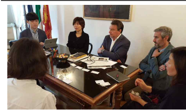
[시의회 의원 면담①]