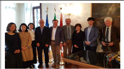
[시의회 의원 면담②]