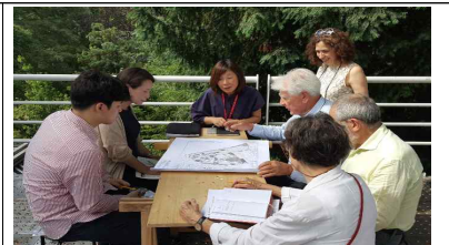
[계획안 청취 및 검토의견 교환]