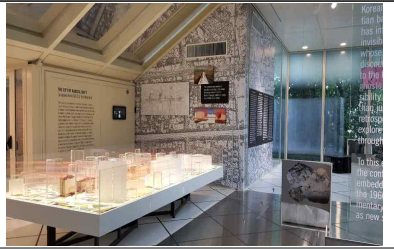
[한국관 설치 내부]