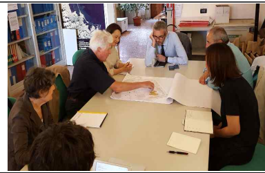
[한국관 증축 초기계획안 설명]