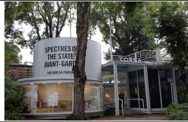
[한국관 설치 전경_외부]