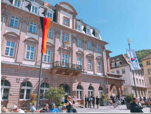
하이델베르크시청(주빈국 태극기 계양)