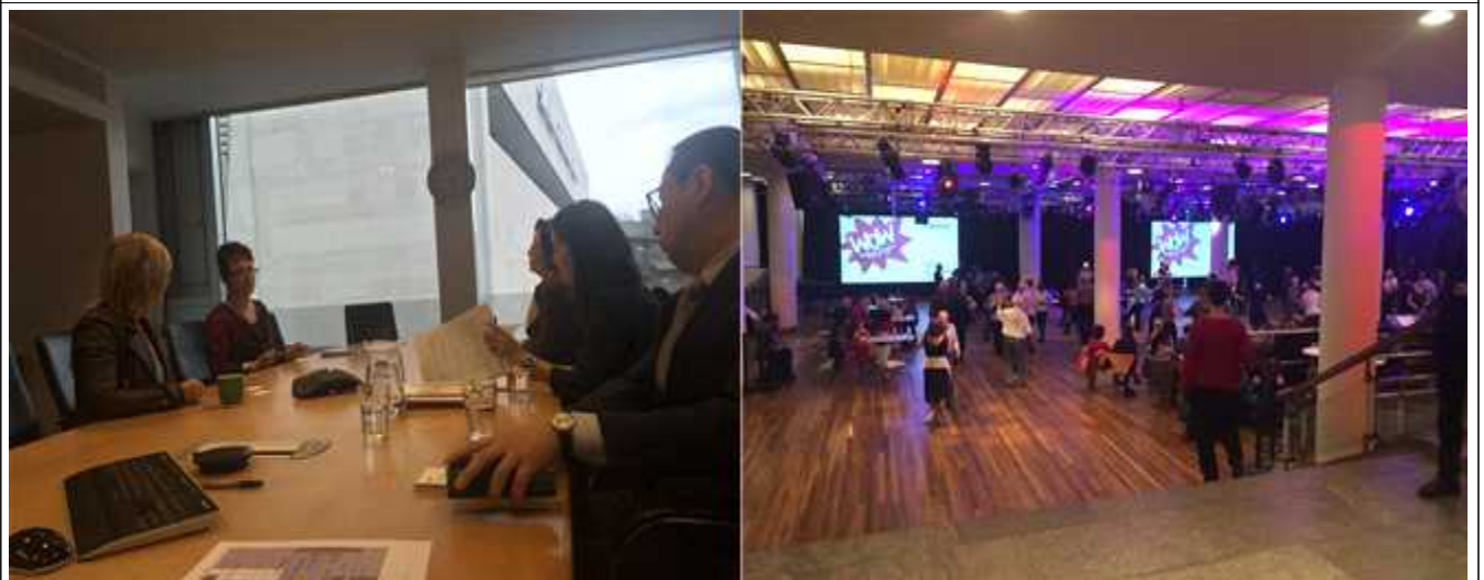
Southbank 공간 투어 및 관계자 면담 모습