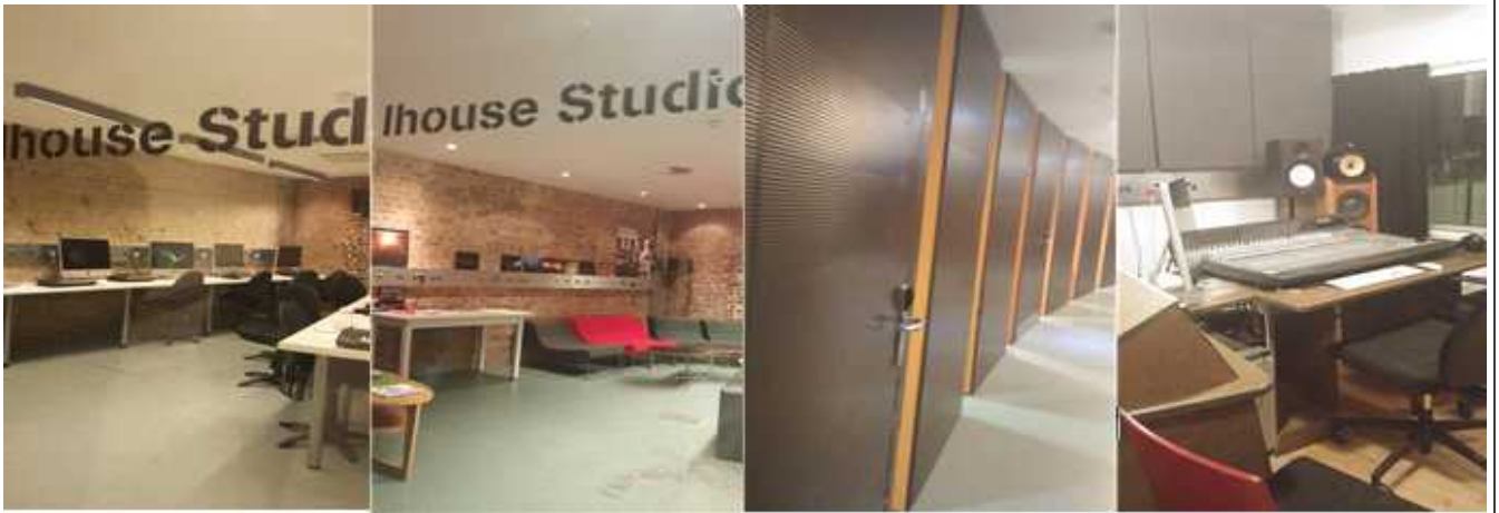
라운드 하우스 연습공간 모습