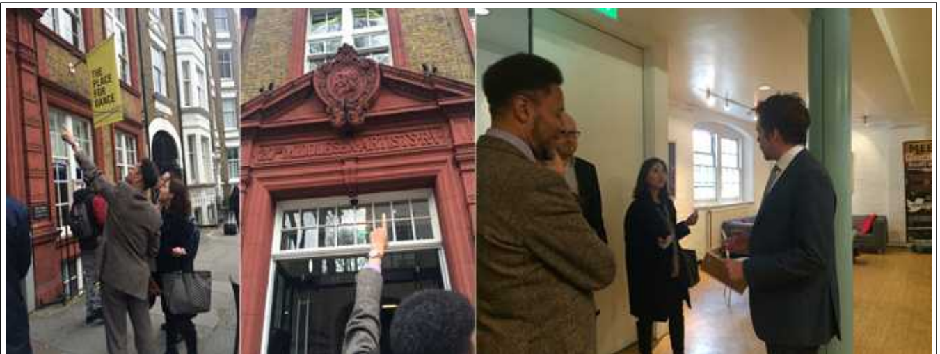
The Place 공간 투어 및 관계자 면담 모습