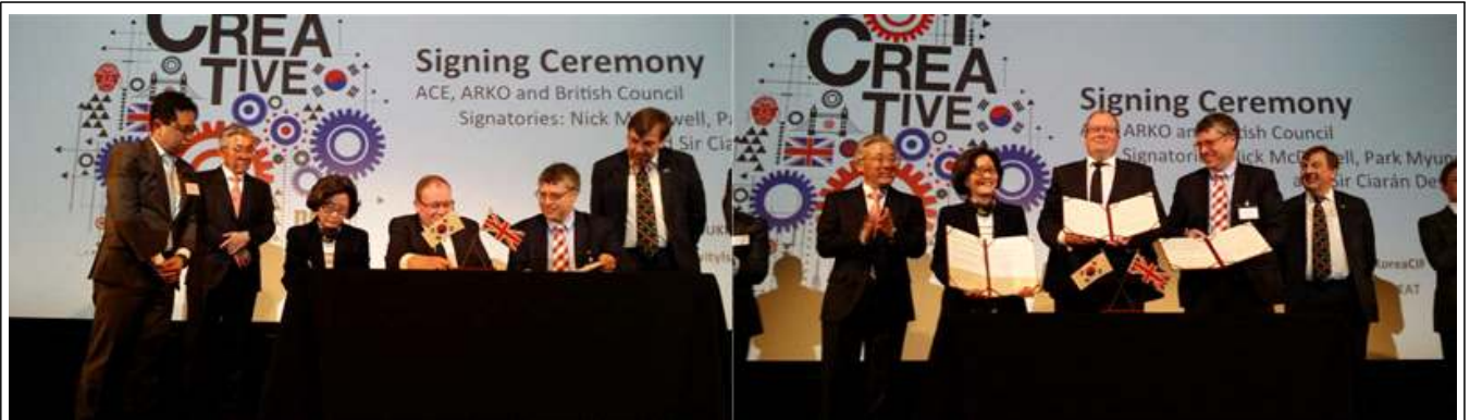
왼쪽부터 김종덕 문화체육관광부 장관, 박명진 한국문화예술위원회 위원장, 대런 헨리 영국예술위원회(ACE) 사무총장, 키아란 디반 영국문화원 CEO, 존 위팅데일 영국문화통신스포츠부(DCMS) 장관