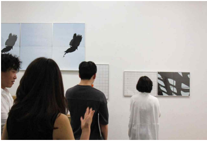
명륜동 작업실 2019년도 오픈스튜디오