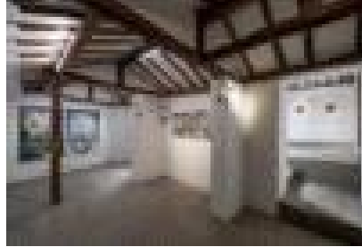
2022 명륜동 작업실 결과보고전 《이것이 이야기는 아니지만》 전시 전경