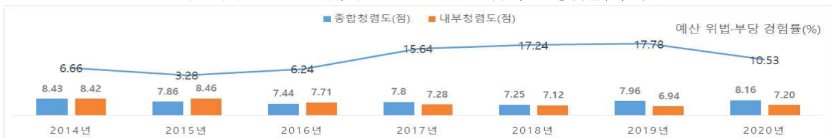
<한국문화예술위원회 내부청렴도 및 예산 위법·부당 경험률(%) 추이>

* '17년 이전 ①업무추진비, ②운영비·여비·수당, ③사업비 3개 부문 조사하다 '18년부터 통합 * 시계열 비교를 위하여 '17년 이전 3개 부문 조사 값 합산하여 산출