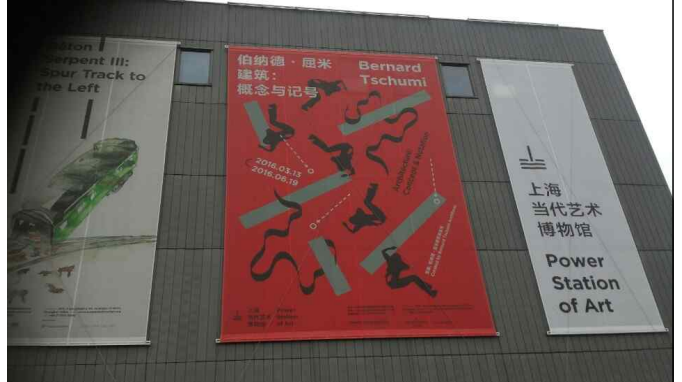
△ 상해현대예술박물관 관람('16.6.16)