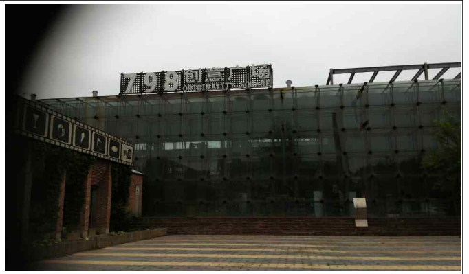
△ 북경 798예술구 방문('16.6.14)