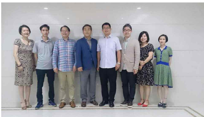
△상해문련 방문 및 간담회('16.6.15)