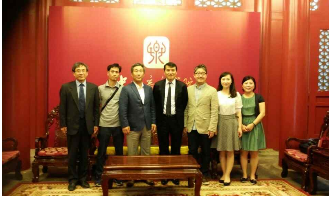
△중국음악학원 방문 및 부총장 면담('16.6.13)