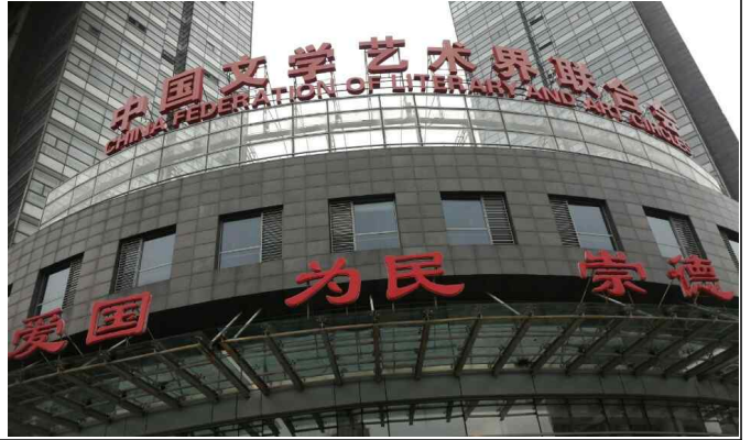
△중국 문련(북경) 방문 및 간담회('16.6.13)