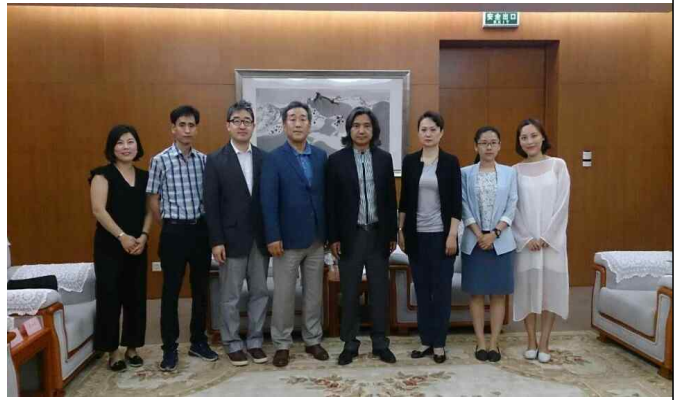
△중국미술관 방문 및 관람 및 관장 면담('16.6.14)