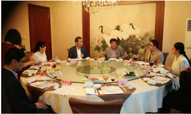
△중국 문련 환영 만찬('16.6.13)