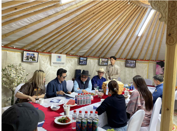
나담 축제 및 몽골예술위원회 위원, 몽골경영위원회 위원 미팅