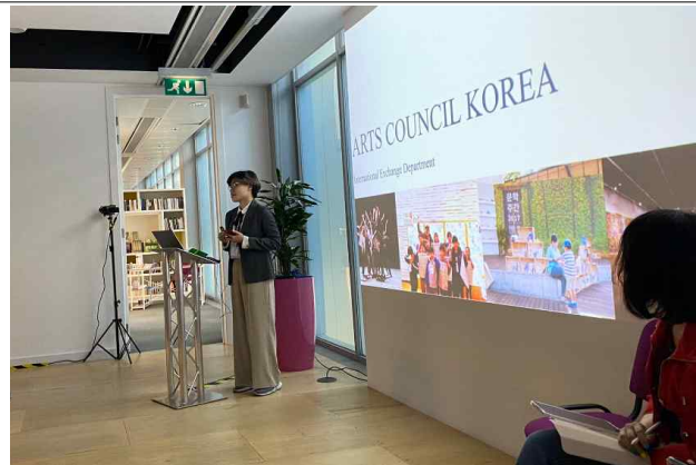
국제 예술가 교류 행사(MOMENTUM) 참석