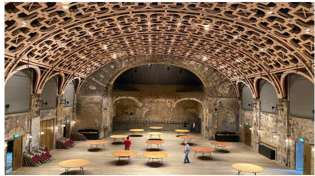
극장 간 협력 프로그램 발굴을 위한 현장 답사