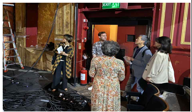
한국예술국제교류지원사업 다중 지원 극장(코로넷 씨어터) 모니터링