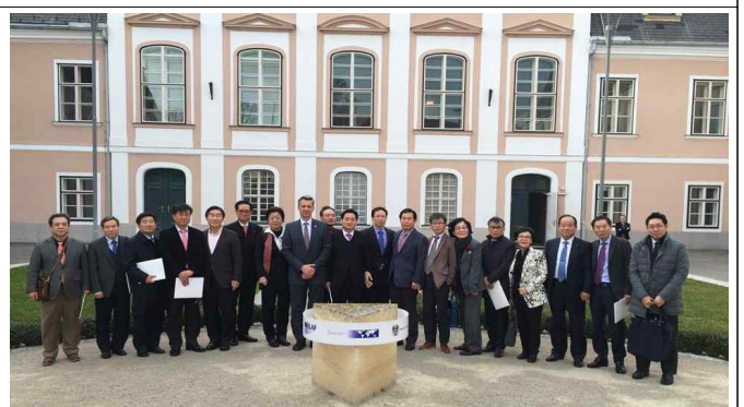
국제반부패아카데미(IACA)회의 참석 및 참석 감사인 단체사진