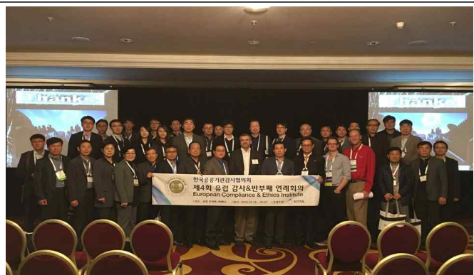
제4회 유럽 감사&반부패 연례회의 참석