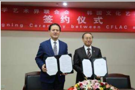
한국문화예술위원회-중국 문련 mou 체결모습

정율성 음악축제는 중국의 3대 혁명 음악가로 칭송받는 광주 출신 정율성 선생의 음악과 예술혼을 널리 알리고, 아시아를 아우르는 국제적인 문화 콘텐츠를 발굴을 위해 2005년도부터 현재까지 추진되고 있음 (광주광역시 주최, 광주문화재단 주관)