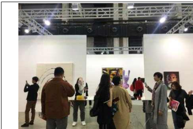
상하이 웨스트번드 아트센터 방문