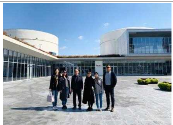
탱크 상하이 방문