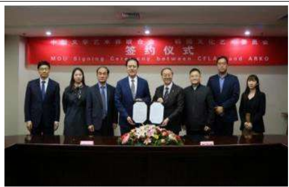
한국문화예술위원회-중국 문련 mou 체결모습