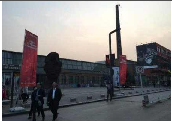
북경 798 예술구 방문