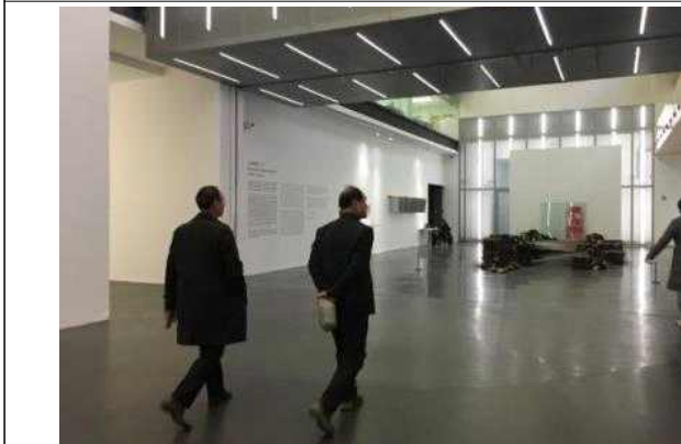
북경 798 예술구 방문