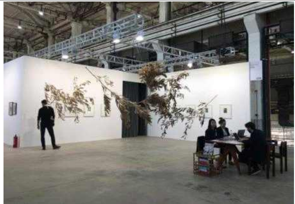
상하이 웨스트번드 아트센터 내부