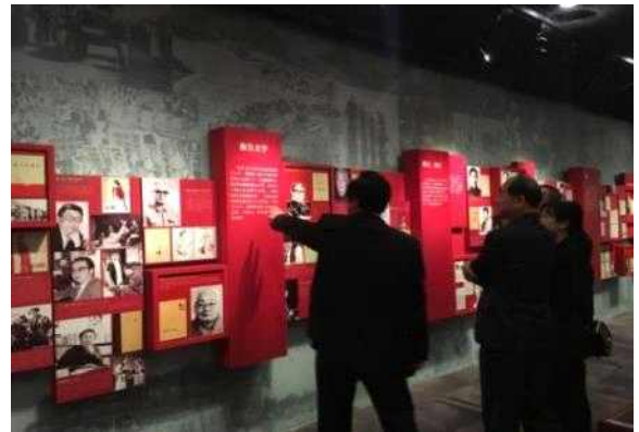
중국현대문학관 시설 방문 및 투어