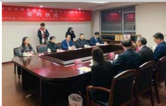
예술위 대표단-중국 문련 부주석 환영 차담회