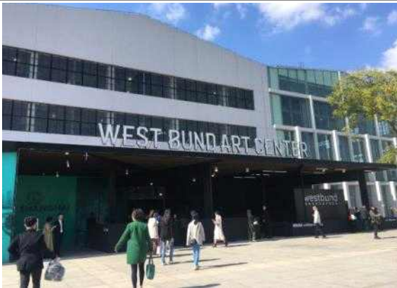
상하이 웨스트번드 아트센터 외관