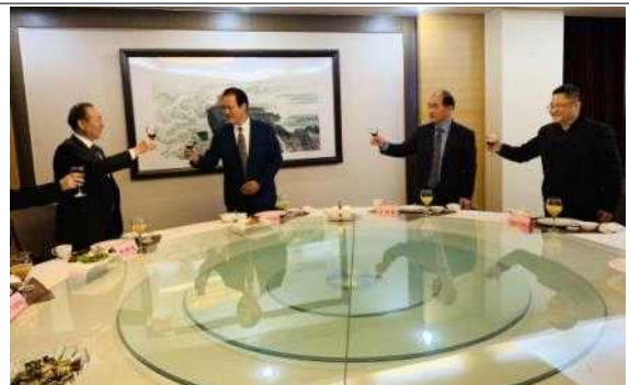
중국 주최 환영 만찬 참석 모습