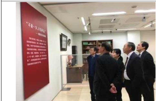
중국현대문학관 시설 방문 및 투어