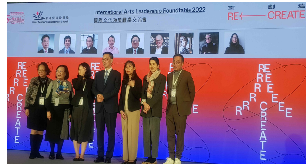
홍콩 국제예술리더십 라운드테이블