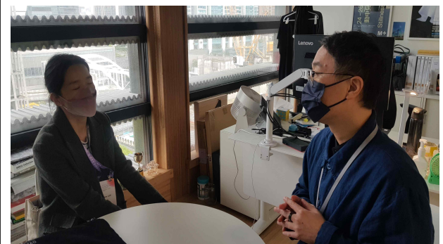
주홍콩한국문화원 및 문화예술시설 방문