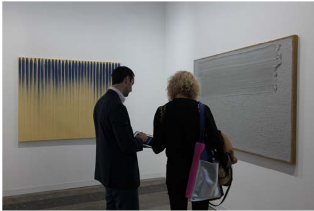
(아트바젤 홍콩) 블룸&포 갤러리에서 선보인 이우환, 하종현 작품