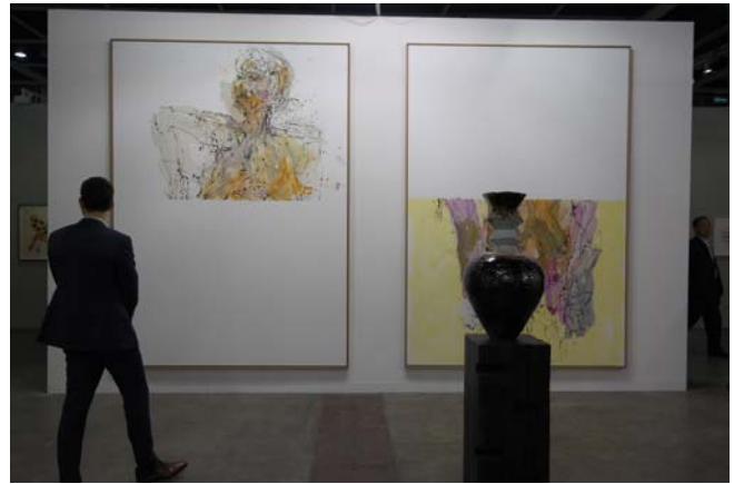
(아트바젤 홍콩) 화이트큐브에서 선보인 게오르그 바젤리츠(Georg Baselitz)의 작품