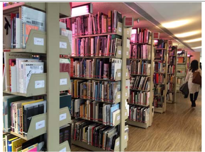
(아시아아트아카이브) 아카이브 전경