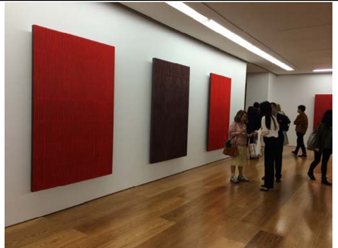
(아트갤러리나이트) 갤러리 패로탱의 서도호 전