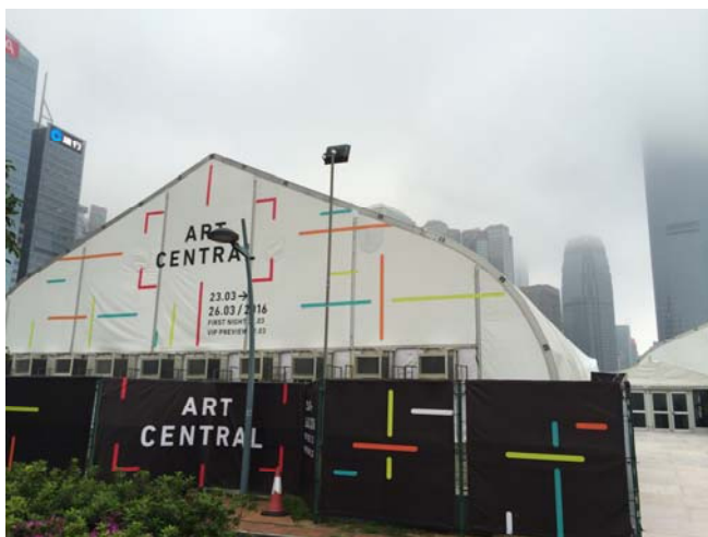
(아트센트럴) 전시장 전경(야외 천막 활용)