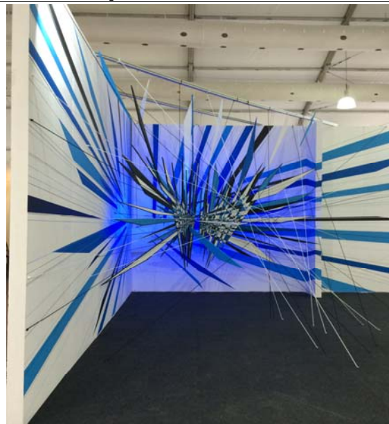
(아트센트럴) 전시 설치 중 일부