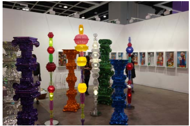
(아트바젤 홍콩) 최정화 작가를 선보이며 인사이트에 참여한 박여숙 화랑 부스