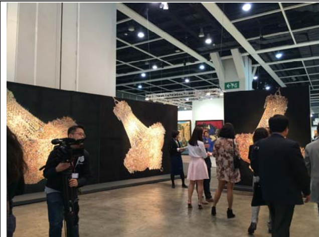
(아트바젤 홍콩) 엔카운터 섹션에서 선보인 함경아 작가의 <다섯 도시를 위한 상들리에>