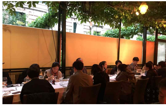
[기자단 만찬 진행]