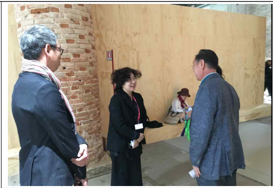
[아르세날레 강○○ 작가 미팅]