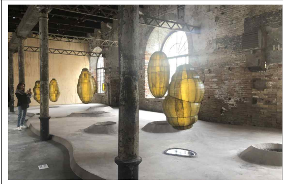
[아르세날레 내 아니카이 작가 작품]