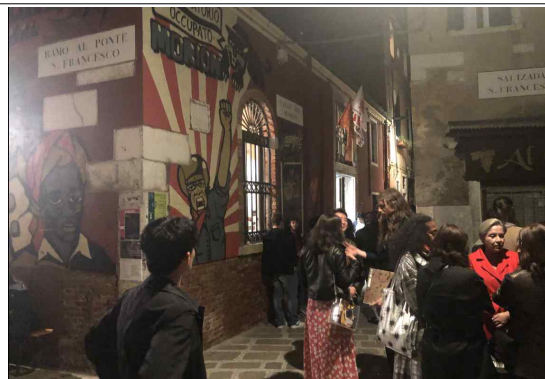
[애프터 파티 행사장]