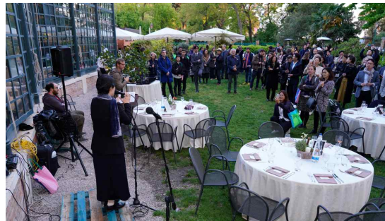
[공식 만찬 전경]