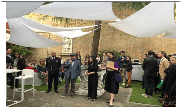
[인사말 전하는 윤○○ 관장]