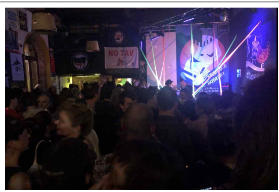
[애프터 파티 전경]