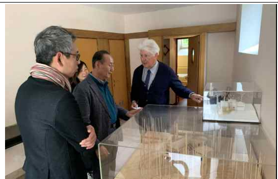
[한국관 관련 개인소장자료 소개]