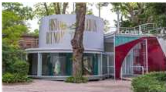
[한국관 설치 전경_외부]