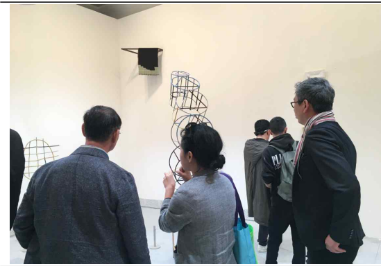
[자르디니 내 강○○ 작가 작품]