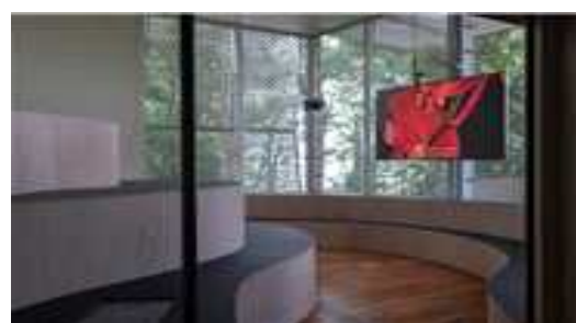
[한국관 설치 내부]