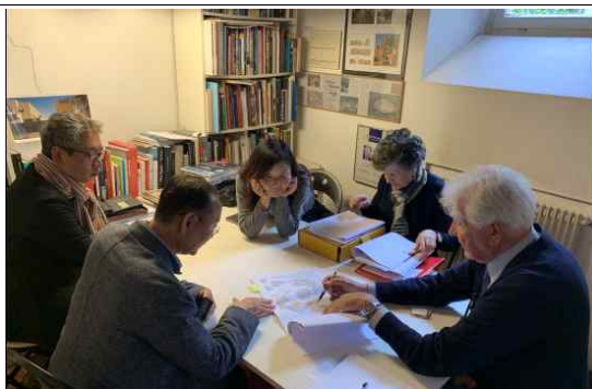
[한국관 증축 진행과정 설명]