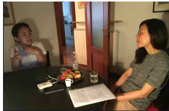
[한국관 주제사 구술채록진행장면]