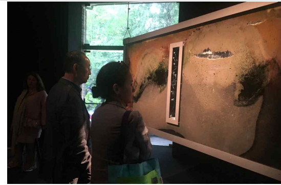
[자르디니 내 아니카이 작가 작품]