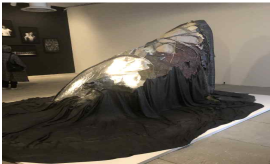
[자르디니 내 이불 작가 작품]