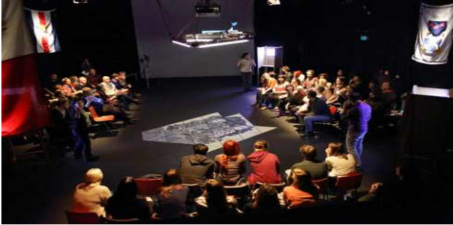
Small Town Anywhere