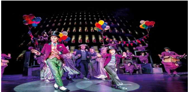
<Charlie and the chocolate factory>