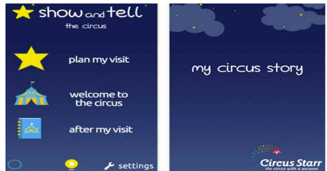
Circus Starr <Circus Starr>