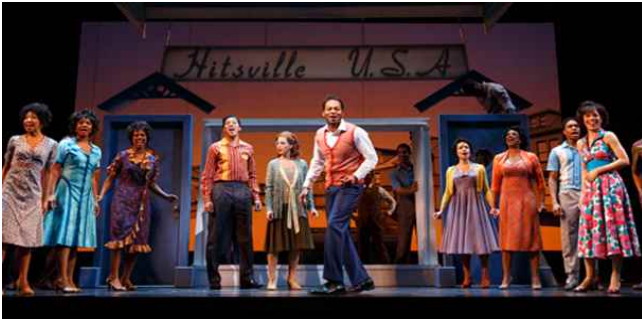
<Motown the musical>