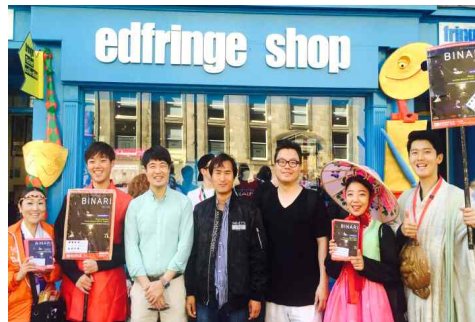
코리안시즌 참여단체 '극단 맥'

에든버러프린지페스티벌 중 어셈블리페스티벌 코리안 시즌은 에든버러 주요 극장 Assembly와 한국 공연기획/제작사 AtoBIZ가 공동기획한 프로그램으로 2016년도 2회째를 맞음