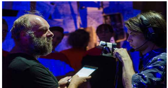
Coney <Better than Life>