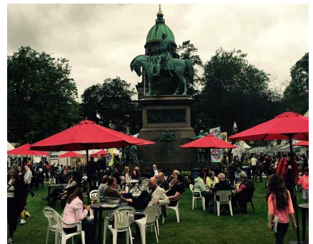
<Edinburgh Book Festival>

George Square Gardens> 공원 내 특설 공연장, 놀이기구 등 마련하고 서커스, 어린이 대상 작품 등을 중심으로 운영