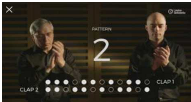
London Sinfonietta <Clapping music app>