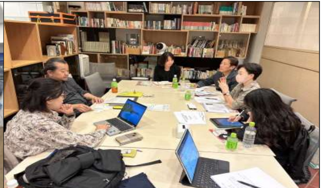
가나가와 예술극장 관계자(부관장)와 간담회