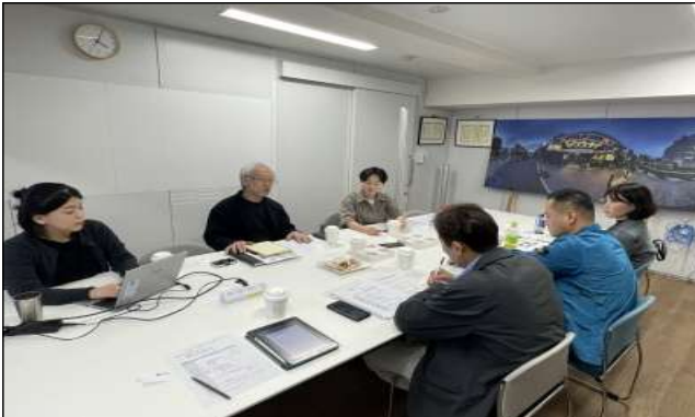
씨어터 워크숍 대표 및 관계자와 간담회