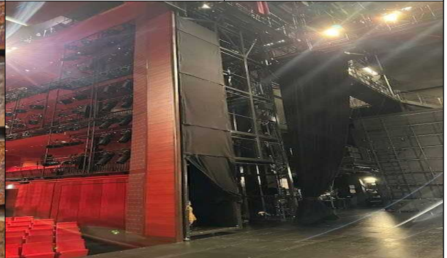
가나가와 예술극장 프로시니엄 이동 레일