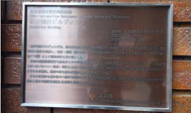
기노쿠니야 홀 역사적 건축물 안내판