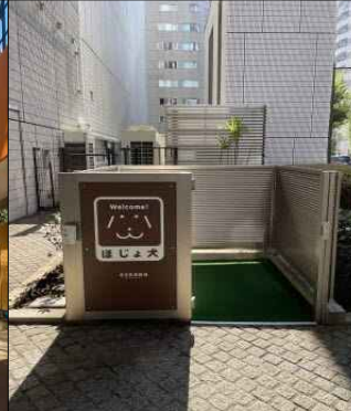
보조건 샤워실 도쿄예술극장