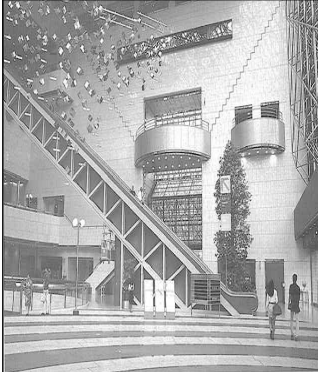
리모델링 전 로비 도쿄예술극장