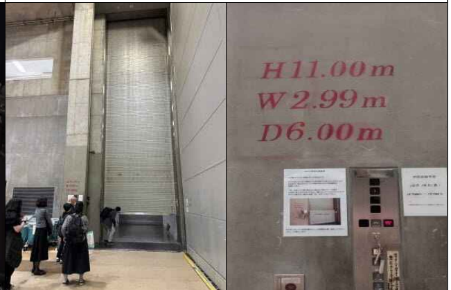
신국립극장 세계 최대 화물 엘리베이터