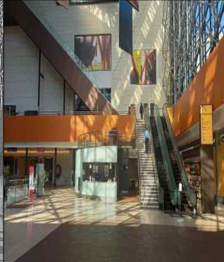
리모델링 후 로비 도쿄예술극장