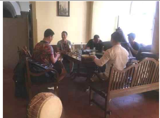
개막식 공연 사전 연습 (4인놀이)