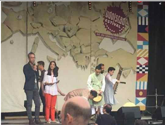
EBU 민속축제 개막식 프리젠테이션