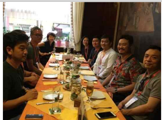
참여자 간담회 (4인놀이, KBS PD)