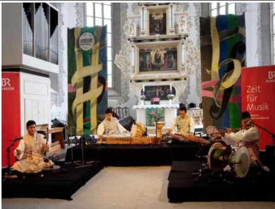
4인놀이 본공연 (Stadtkirche)