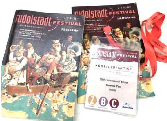
2019 루돌슈타트 페스티벌 프로그램북 및 아티스트 패스