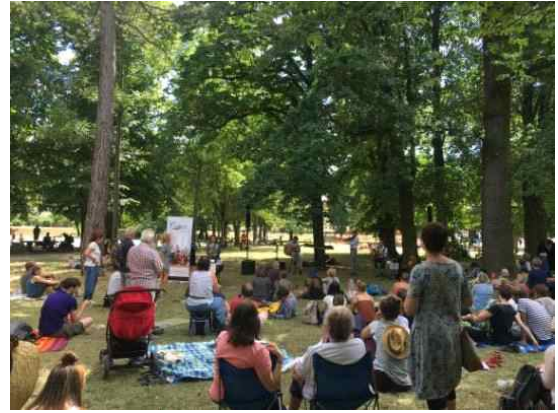
2019 루돌슈타트 페스티벌 전경2 (Heinepark)