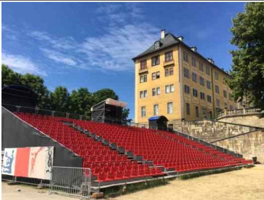
2019 루돌슈타트 페스티벌 야외공연장 (Burgterrasse)