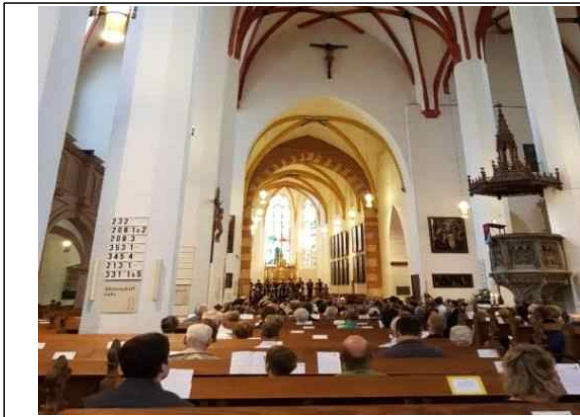
2019 국제예술교류지원사업 모니터링 - St.Thomaskirche 공연 (콜레기움 보칼레 서울)