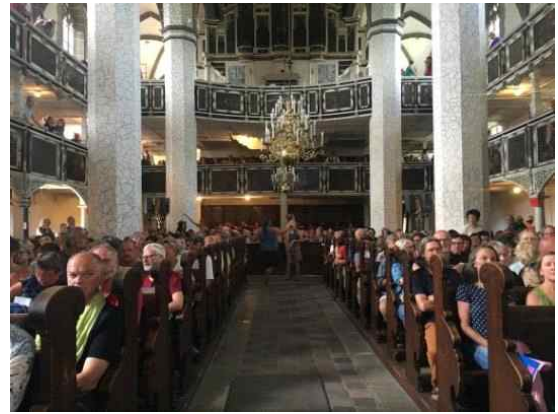
4인놀이 본공연 관람객 모습2