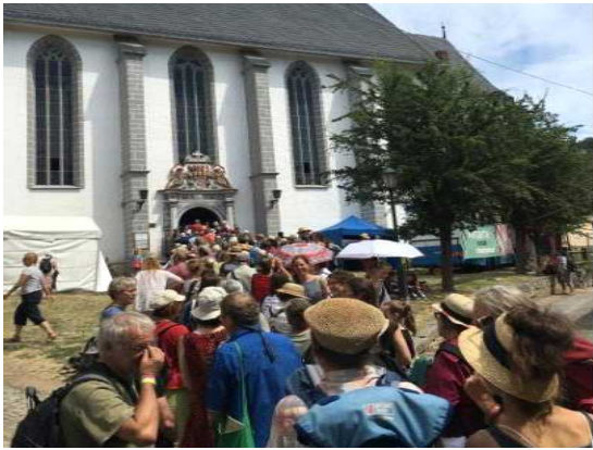
4인놀이 본공연 관람객 모습1