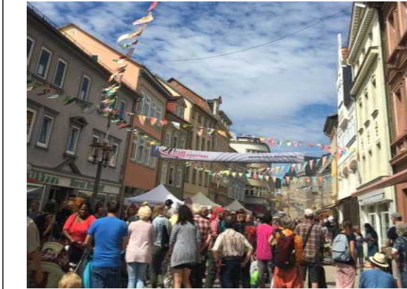
2019 루돌슈타트 페스티벌 전경