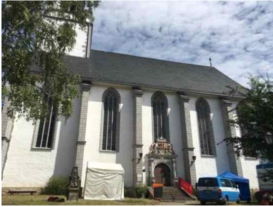
본공연장 외관 (Stadtkirche)