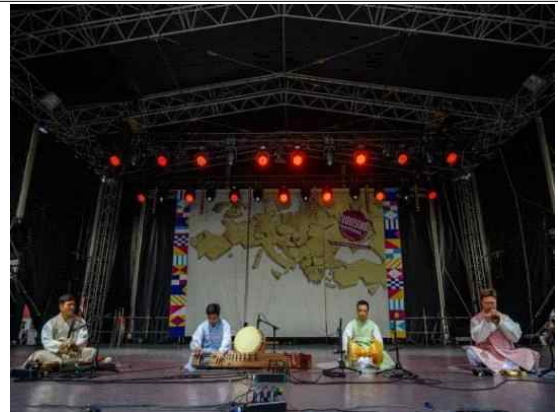
EBU 민속축제 개막식 공연 (4인놀이)