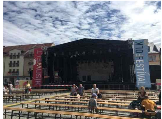
EBU 민속축제 개막식 장소 (Markt Große Bühne)