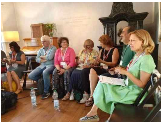
EBU 프로듀서 미팅 (Schillerhausgarten)