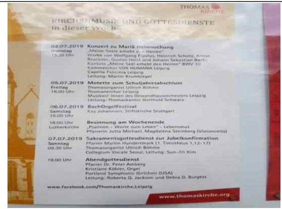
2019 국제예술교류지원 사업 모니터링 - 공연 리플렛 (콜레기움 보칼레 서울)