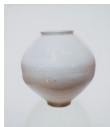
만월 2020, 캔버스, 석고에 아크릴릭 152x130cm