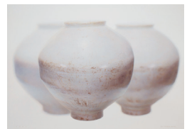
어제, 오늘, 그리고 내일 2020, 캔버스, 석고에 아크릴릭, 132.5x185cm