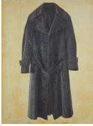
코트 1973, 캔버스에 유채, 160x120cm