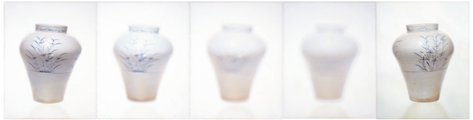
패랭이꽃-1, 2, 3, 4, 난 2013, 캔버스, 석고에 아크릴릭, 160x126x(4), 160.5x126.5 국립현대미술관 소장