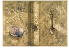
한국사 1991, 천에 아크릴릭, 210x301cm 토탈미술관 소장