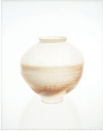
생명-달항아리 2002, 종이, 석고에 유채, 162x128cm