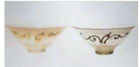
이이일(二而一, One in Two) 2020, 캔버스, 석고에 아크릴릭, 80.5x180.5cm