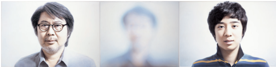
세대(Generation) 1-The Father, 2-Ko, 3-The Son 2014, 캔버스, 석고에 아크릴릭, 145x200cm, 135x160cm, 135x200cm