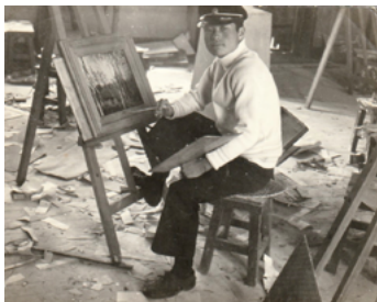
1969년 원광고등학교 3학년 시절에 미술실에서의 작가의 모습. 같은 해에 고등학생 신분으로 제1회 전라북도미술대상전에서 〈가을 잎이 지듯이〉라는 작품으로 입상