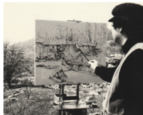
1980년대 야외에서 사색하는 작가의 모습 전경