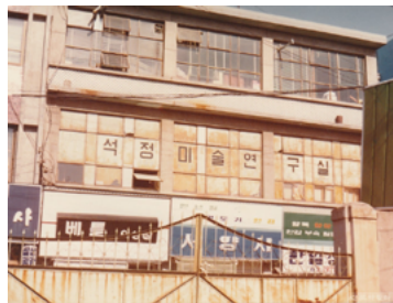
1980년대 작가의 작업실 '석정미술연구소'의 건물 모습 전경