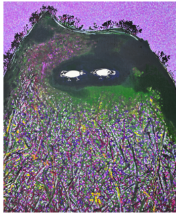
생명 72.7×60.6cm, 캔버스에 유채, 2012