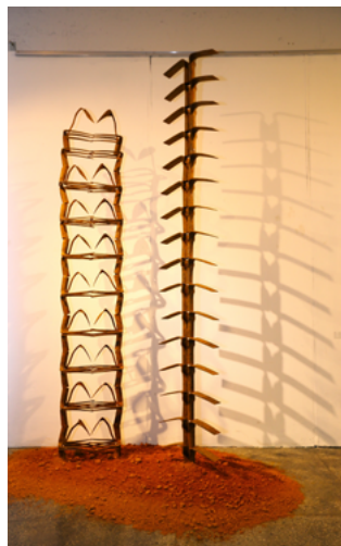
생명_날개의 숲 (좌)42.0×240.0×17.0cm, (우)45.0×264.0×7.0cm, 호미, 철용접, 2020