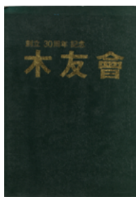
1988년 창립 30주년 목우회 미술전람회 도록 표지이미지