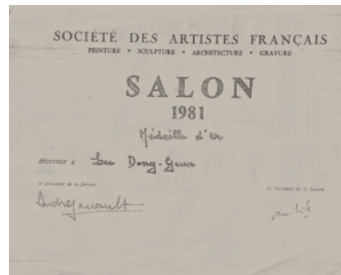
프랑스 《Le Salon SAF: Société des Artistes Français(파리 그랑팔레미술관)》에서 수상했던 금상 상장 이미지