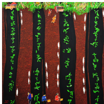
생명 150×2150cm, 캔버스에 유채, 2013