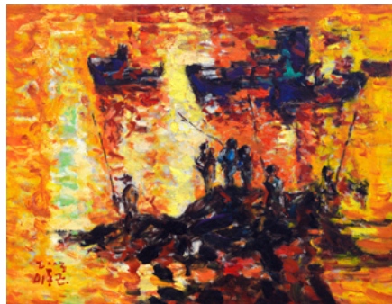
여수에서 31.8X40.9cm, 캔버스에 유채, 2003