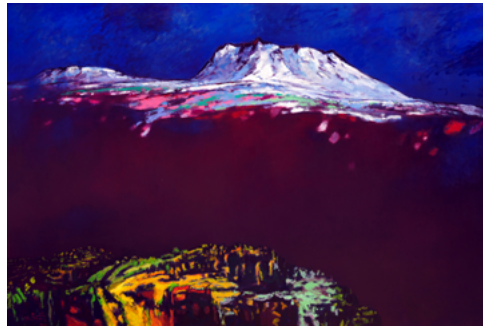
한라산 197.0×290.9cm, 캔버스에 유채, 1998