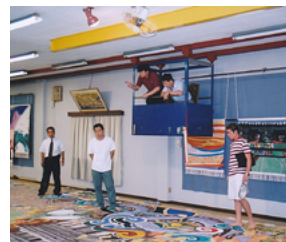
2001년 한국소리문화의전당 모악당 초대형 무대막 설치작품 〈소리사랑〉 제작 과정 전경