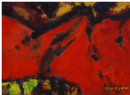
붉은 산 24.1×33.4cm, 캔버스에 유채, 1972