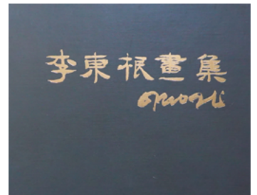
1982년 작가의 첫 개인전과 함께 출간한 〈이동근화집(李東根畫集), 원광사, 1982.9.5.〉의 표지이미지