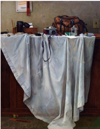
하얀 천이 있는 정물 145.5×112.1cm, 캔버스에 유채, 1985