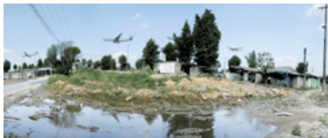
오소리 풍경 6 2004, digital pigment print, 100 × 261 cm

2015 루나 포토 페스티벌 올해의 작가 2008 동강 사진예술상 (동강사진예술위원회) 2006 올해의 예술가상 시각예술부문 (한국문화예술위원회)