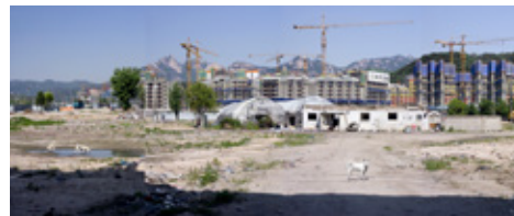
은평 뉴타운 - 흰 개 2009, digital pigment print, 90 × 220 cm