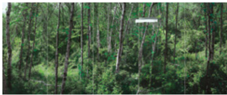
녹색연구 - 흰 자작나무 A 2012, digital pigment print, acrylic, 190 × 480 cm