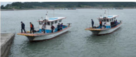
어의도 1 - 016 2021, digital pigment print, 100 × 240 cm