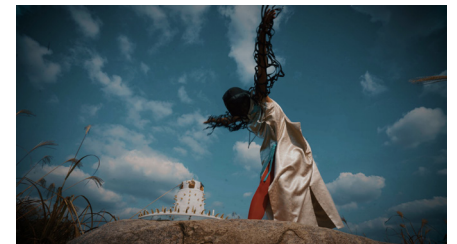
헤르마프로디토스 돌기신화-드림잉 클럽 싱글채널 비디오, 컬러, 사운드, 5분 10초, 2022