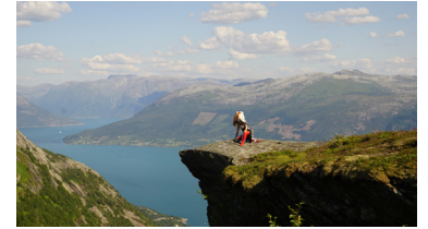
유가의 꿈 미국 화이트사막에서 퍼포먼스 사진& 피그먼트 프린트, 168.5x80cm, 2018 노르웨이 울빅_댐맨의 여전사 피그먼트 프린트, 43x76cm, 2019