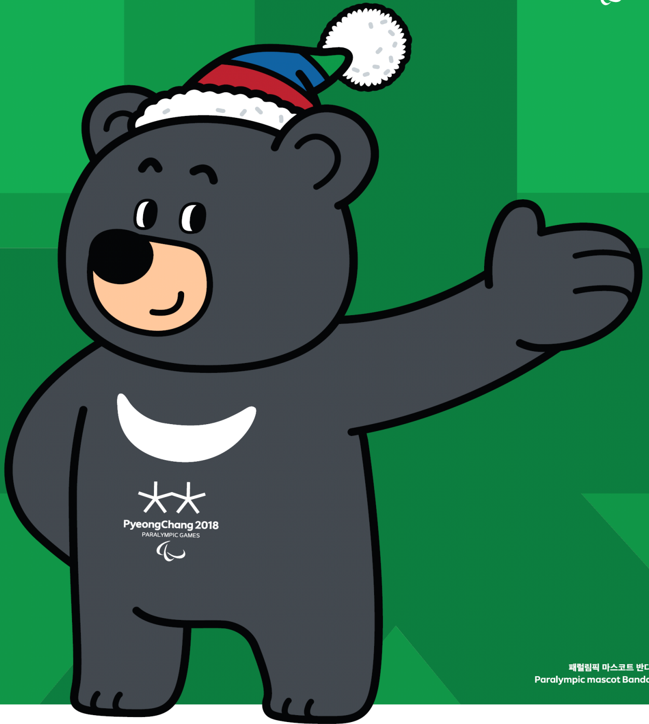
패럴림픽 마스코트 반다비 Paralympic mascot Bandabi